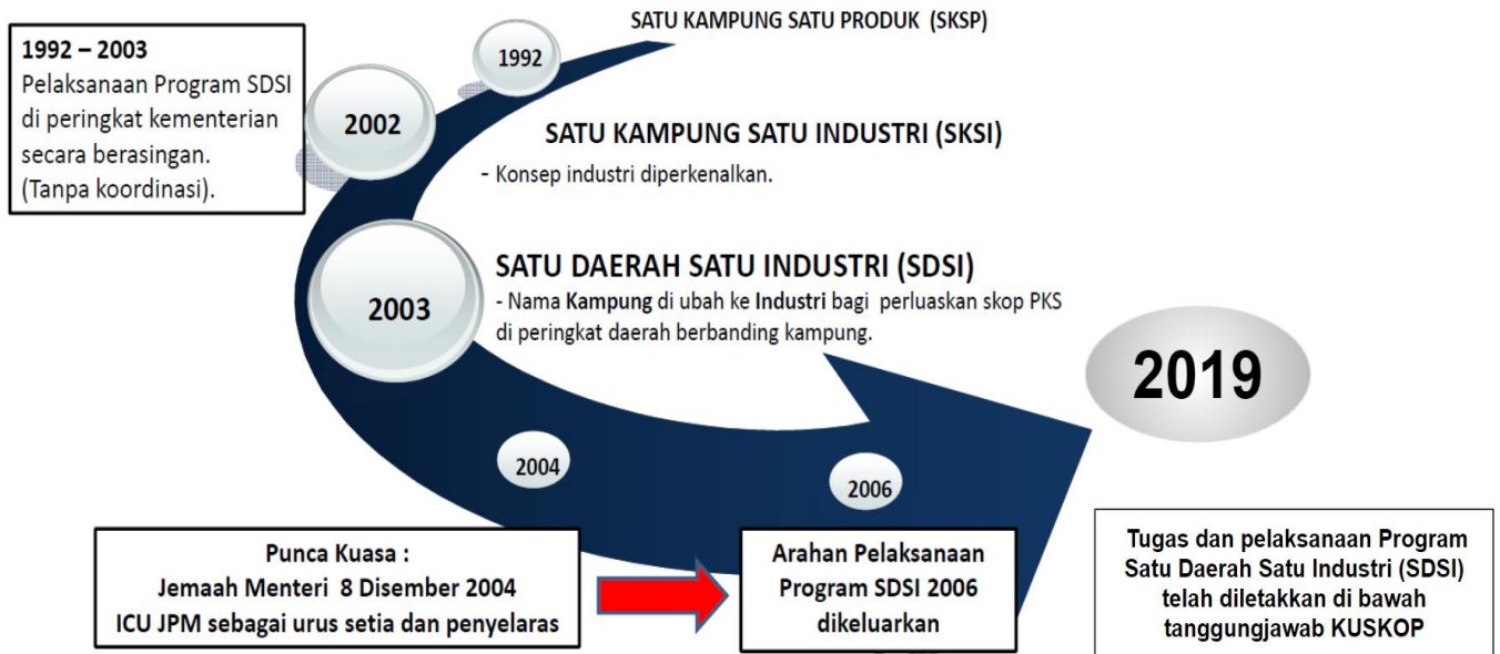
Rajah 1: Evolusi Program SDSI Di Malaysia