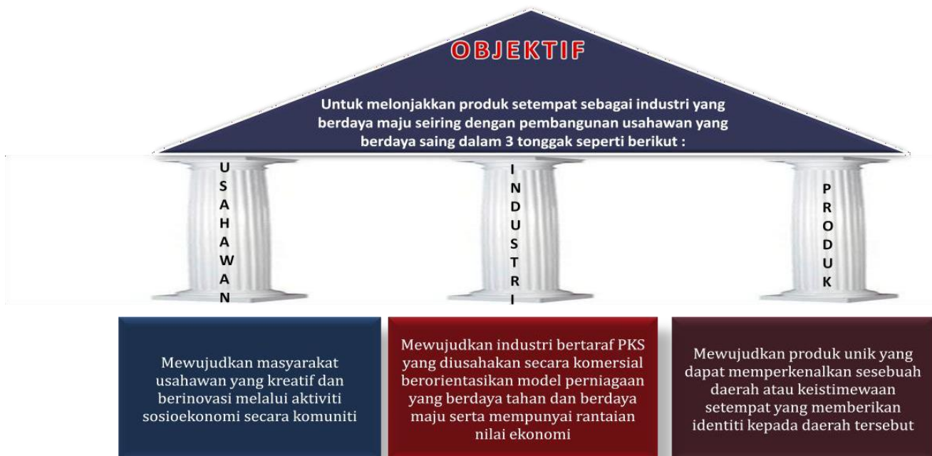
Rajah 2: Objektif Program SDSI