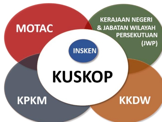
Rajah 3: Kerjasama antara Kementerian Peneraju bersama rakan strategik