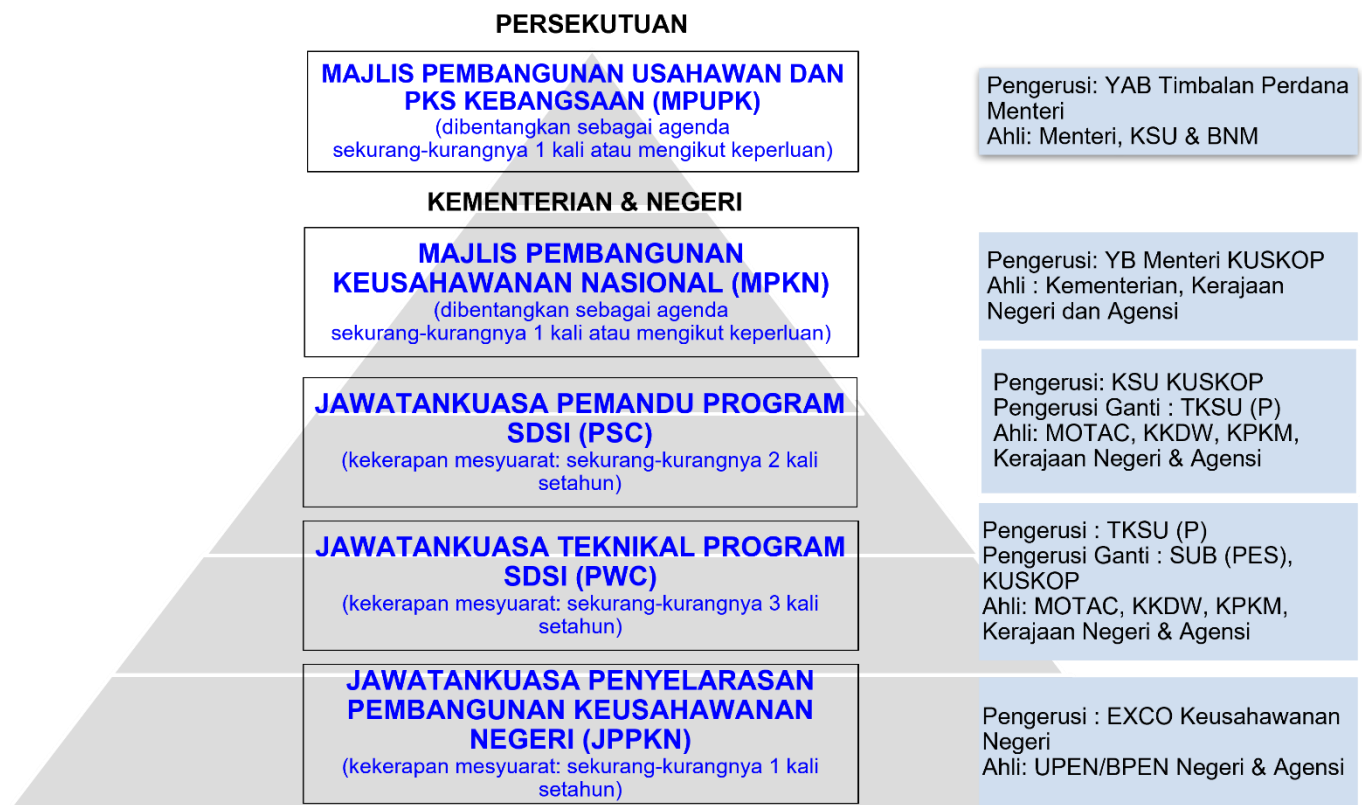
Rajah 6: Jentera Penyelarasan Pelaksanaan Program SDSI